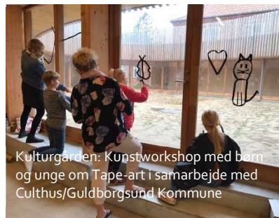
Kulturgården: Kunstworkshop med børn og unge om Tape-art i samarbejde med Culthus/Guldborgsund Kommune