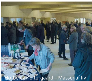
Horbelev kulturgaard – Masser af liv

BEDRE BREDBÅND PÅ NORDØST FALSTER FASE 2