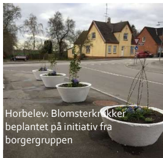
Horbelev. Blomsterkrukker beplantet på initiativ fra borgergruppen