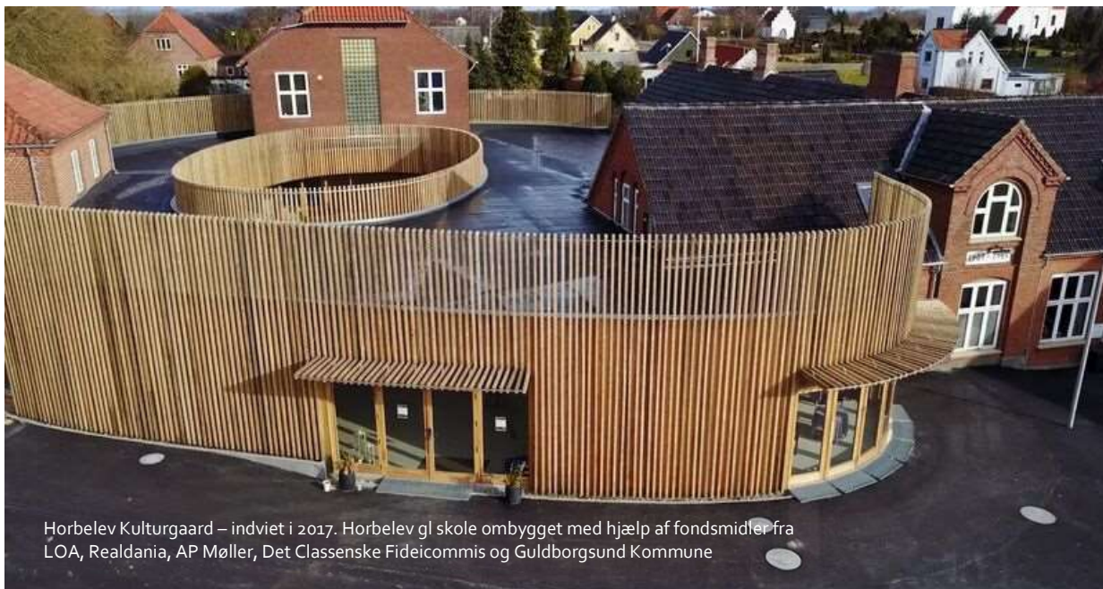
Horbelev Kulturgaard – indviet i 2017. Horbelev gl skole ombygget med hjælp af fondsmidler fra LOA, Realdania, AP Møller, Det Classenske Fideicommis og Guldborgsund Kommune

Projektet vil være en opbakning og støtte til de ting der i forvejen er etableret kulturgården og idrætsforeningen samt et helt nyt tiltag hvor alle institutioner forsamlingshuse, restauranter og cafeterier samt hallen og Bed & Breakfast og mange flere. Det er et håb at videreudvikle den ejerskabs fornemmelse som er skabt via kulturgården i den gamle skole. Det er intentionen at projektet skal videreudvikle sammenhængskraften og gøre NØF området til en bæredygtig enhed i kommunen hvor der er plads til alle.